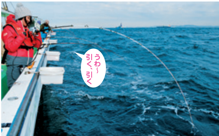
▲ハリス切れの正体はワラサか？ 悔しい~