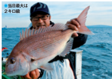
●当日最大は2キロ級

張の表情でヤトリ開始。ほどなく海面にピンク色の魚体を浮かせて玉網に収めると、いつもの笑顔に戻る。0.5キロ級ながら初めてのマダイ、この日の釣りは一生忘れることはないだろう。相変わらず船中では2キロ級のマダイや3キロ弱のワラサなど、多彩なゲストを含めて食いは活発。