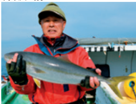
▲後半には青物の回遊も