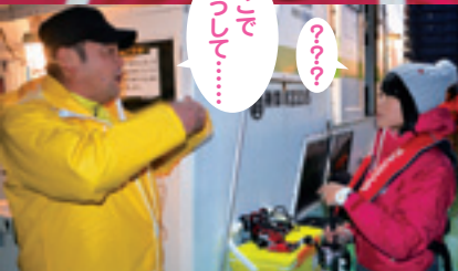
▲出船前に常連さんが現在の状況を教えてくれた

乗船したのは三浦半島京急大津港のいな丸。釣りの久里浜沖は絶対調とも言える釣れっぷりで、連日トップ2ヶ月前後、30枚オーバーも記録している。初体験の彼女でも1枚は釣れるだろうという算段だ。