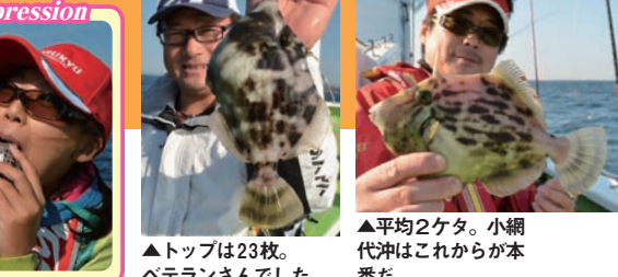
impression ▲トップは23枚。ベテランさんでした

園望の感想 ♥釣って楽しく、食べておいしいカワハギ釣りにすっかりハマってます。今日こそ夢の30センチオーバーともくろんでいましたが、26センチ止まり。今回の反省は次回に生かし、30センチオーバーを釣るようがんばります。