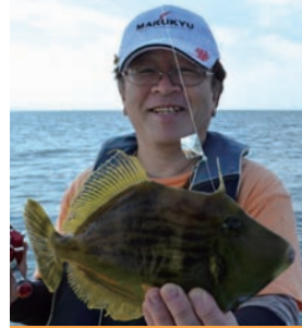
▲この日最大は27センチだった

前半はポツポツ程度。彼女はエサを替え、仕掛けを替えて食いつきのカワハギに対処していく。船中で数枚のカワハギが上がった30分後、小型ながら第1号を釣り上げてホッと一息の表情だ。ようやくスイッチが入ったようで、その後はいいペースでカワハギを掛けていく。 「パターンが分かった」 一時は20センチオーバーの良型を連釣したときは周囲も驚くほど。どうやらこの時はエビエサで掛ける釣り方に開眼したようだった。 1時半に納竿。15〜27センチをトップは23枚、彼女は14枚を釣り上げて船中2位。終始食い渋りの中では上々の成績だったと言えるが、 「悔しいです。もっと釣りたいかった」と、とても残念な表情。毎日のように釣りをしている彼女にとっては、やや物足りなかつたのだろう。と同時に、負けず嫌いな性格も垣間見せてくれたのだった。