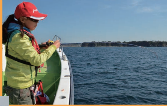
▲巻き上げのスタイルも様になっています