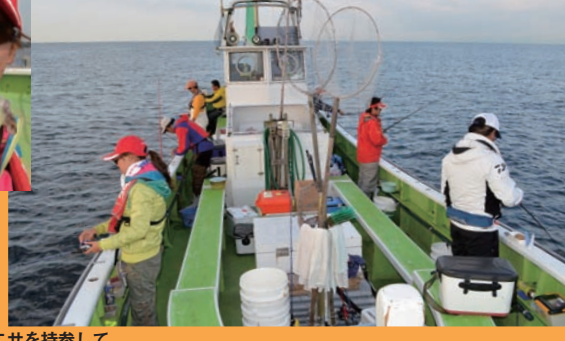
▲平均2ヶタ。小網代沖はこれらが本番だ

今日はエビで勝負よ ▲夢の30センチオーバーには届かなかった ▶当日の小網代沖は潮の動きが今一つだった ◀彼女は色んなエサを持参していた