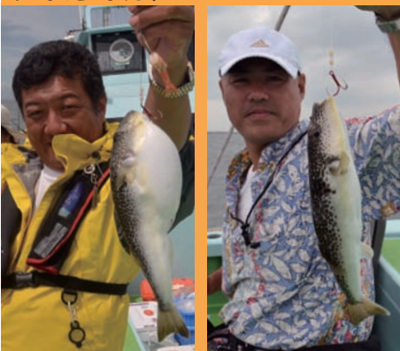
▲たっぷり引きを味わえます