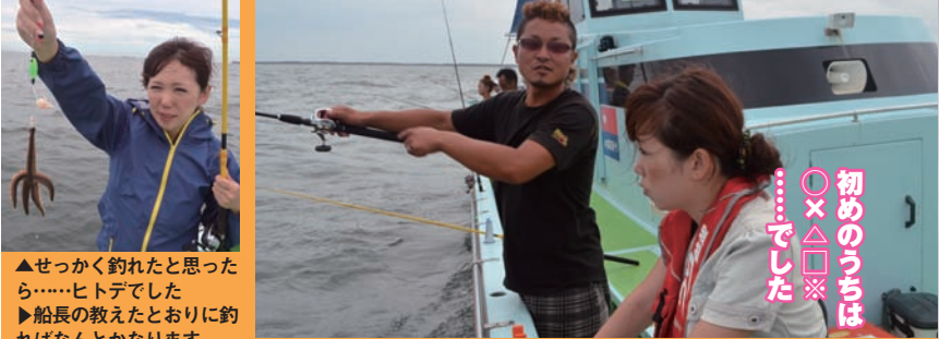
▲せっかく釣れたと思ったら……ヒトデでした ▶船長の教えたとおりに釣ればなんとかなります