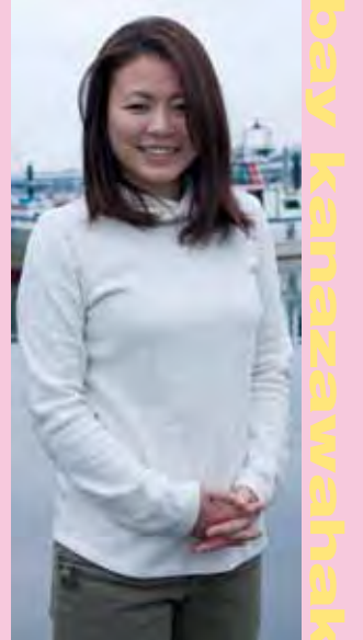
●とにかく魚を食べることが好きで、友人にすすめられるままに釣りに行くことになり、好きになってしまいました。応募も友人のすすめです。