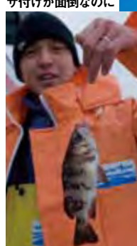
▲乗船者も水温低下に苦戦 ▼型がよかったのが救いだ