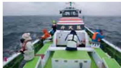
▲八景沖の20～25メートルポイント