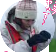
▼手袋をしていたらエサ付けが面倒なのに